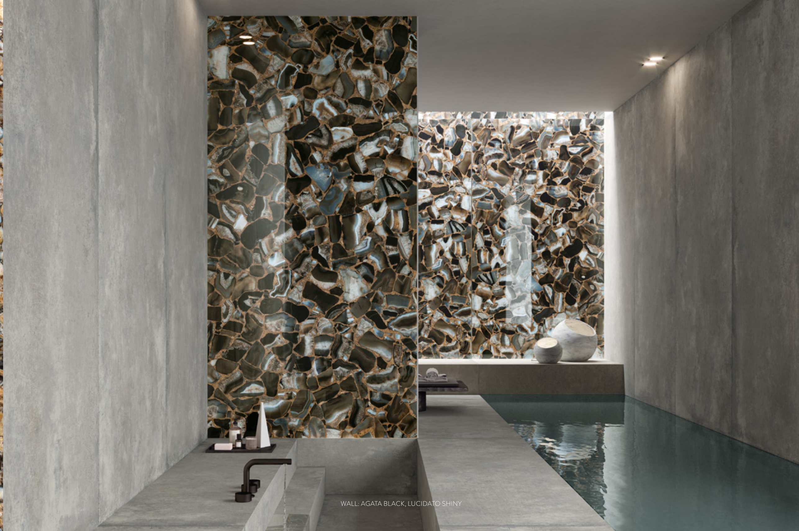
WALL: AGATA BLACK, LUCIDATO SHINY